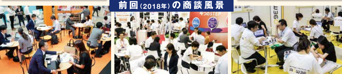
前回(2018年)の商談風景